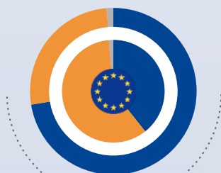
Slovensko (vonkajší koláčový graf)

Európa poskytuje finančnú podporu regiónom a mestám. Počuli ste už o nejakých projektoch na zlepšenie oblasti, v ktorej žijete, spolufinancovaných EÚ? (%)