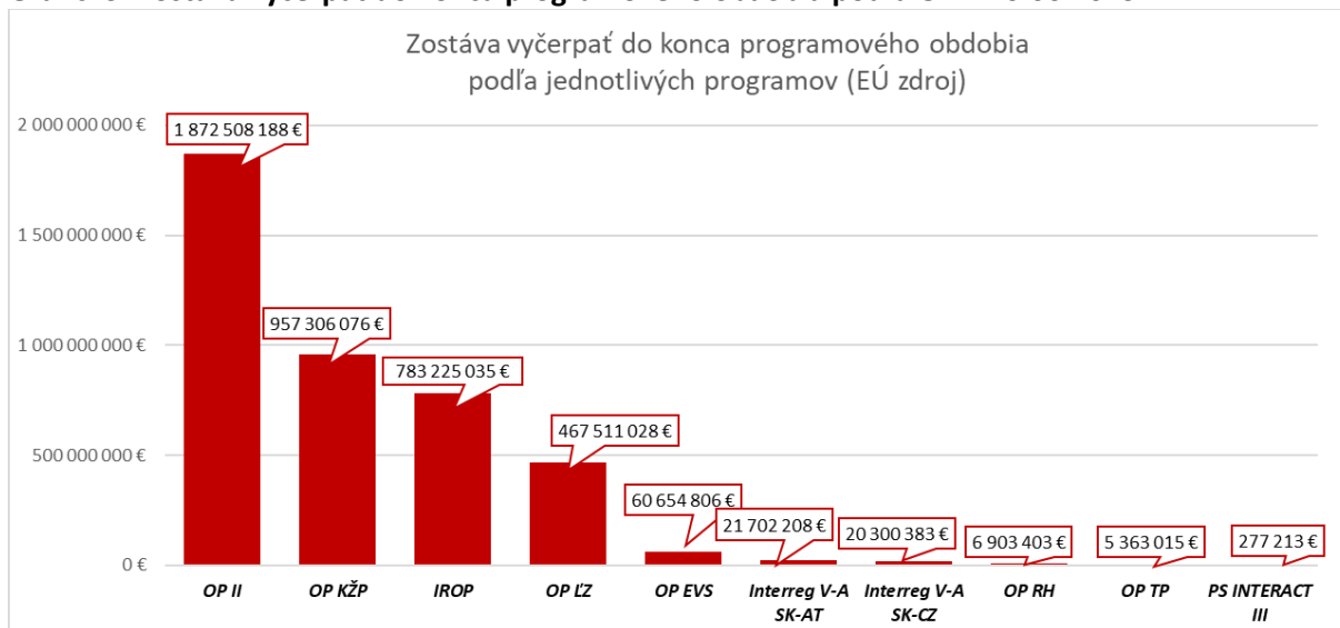
Graf č. 3: Zostáva vyčerpať do konca programového obdobia podľa OP k 16.06.2023

Zdroj údajov: Certifikačný orgán (MF SR)