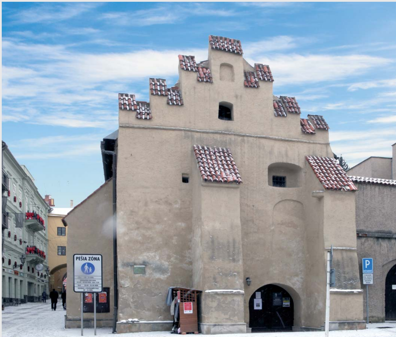
Caraffova väznica v Prešove.