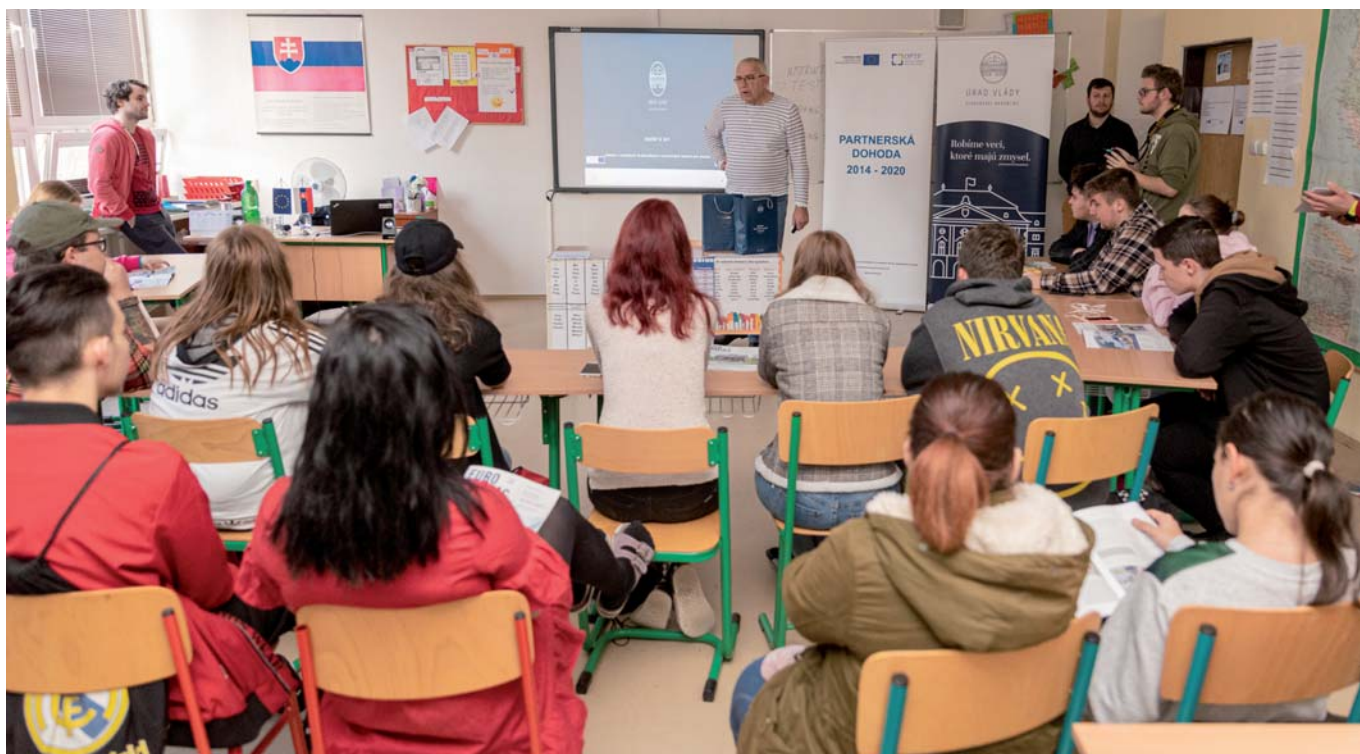
S problematikou financovania projektov pomocou eurofondov sa zoznámili aj študenti zo SOŠ Poľná vo Veľkom Krtíši.

Úrad vlády SR ako realizátor komunikačných a informačných aktivít o čerpaní štrukturálnych fondov pripravil na jeseň tohto roku zaujímavú súťaž pre študentov tretích ročníkov stredných škôl pod názvom RoadTrip SK 2019.