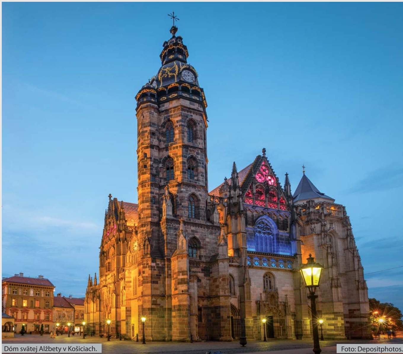
Dóm svätej Alžbety v Košiciach.