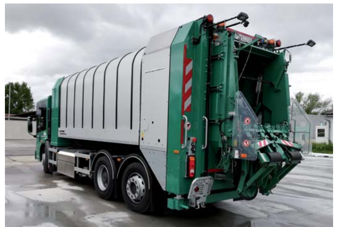
Vozidlo s rotačným lisovaním odváža bioodpad zo zberných nádob pri domoch.

Prínosom je zníženie množstva skládkovaného zeleného odpadu, ako aj zníženie zaťaženia životného prostredia nezákonným spaľovaním a ukladaním odpadu mimo vyhradených zón v meste. Vy-