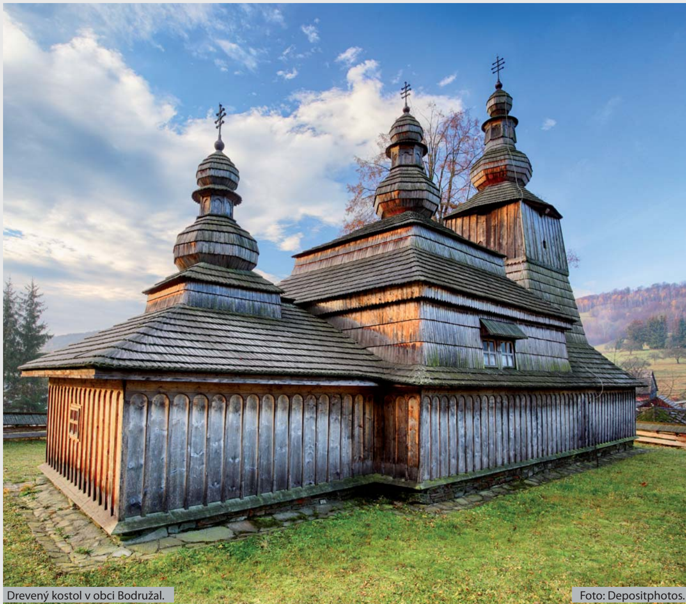
Drevený kostol v obci Bodružal.