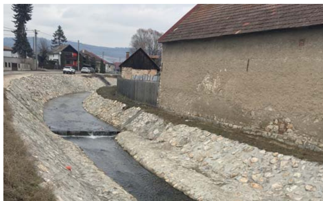
Spevnený úsek koryta potoka Margecianka.

Hlavným cieľom projektu Protipovodňová ochrana na ulici Dr. Špirku v Spišskom Podhradí bolo vyriešiť komplexnú ochranu obyvateľov mesta po oboch stranách toku Margecianky. Vodný tok preteká zastavanou časťou mesta, jeho kapacita, konkrétne na ulici Dr. Špirku, nepostačovala hlavne pri väčších návaloch vody. Koryto bolo zarastené a zanesené splaveninami, brehy bolo treba spevniť. V rámci projektu upravili prietokový profil koryta potoka tak, aby bezpečne zvládol bez vybreženia aj záťažový prietok. Stavebné úpravy nemuseli spĺňať žiadne požiadavky z hľadiska urbanistického a architektonického stvárnenia. Začiatok úpravy bol vymedzený okrajom cestného mosta, koniec priepustom. Úprava toku bola nevyhnutná aj ako prevencia proti ďalším škodám v meste, keďže v súčasnosti často dochádza k prudkým prívalem dažďom.