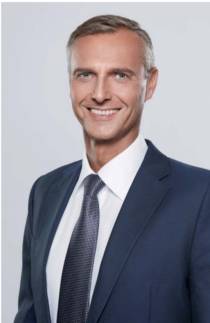
Podpredseda vlády SR pre investície a informatizáciu Richard Raši.

Správa hodnotí našu krajinu vo viacerých oblastiach veľmi pozitívne. Podľa analýzy Európskej komisie sa Slovensku v súčasnosti ekonomicky darí, ale zaostáva v oblastiach, ktoré sú kľúčové pre budúci hospodársky rast, a to najmä v oblasti kvality verejnej správy, vzdelávania, vedy, výskumu a inovácií, vyrovnávania regionálnych rozdielov a kvality životného prostredia. Ďalšími dôležitými výzvami pre Slovensko naďalej zostávajú starnutie populácie, automatizácia, robotizácia a digitalizácia. Fondy EÚ predstavujú príležitosť a ponúkajú možnosti investovať do týchto oblastí a zlepšiť tak rastové vyhliadky Slovenska do budúcnosti. Osobitosťou Správy o Slovensku 2019 je vzhľadom na prepojenie politiky súdržnosti EÚ s Európskym semestrom príloha D, v ktorej Európska komisia zo svojho pohľadu identifikuje konkrétne investičné potreby Slovenska pre financovanie z fondov politiky súdržnosti EÚ na obdobie 2021 – 2027 a poskytuje tak analytický základ pre spustenie negóciácií a procesu programovania európskych fondov na Slovensku. Zverejnením Správy o Slovensku 2019 sa otvoril proces vyjednávania medzi Európskou komisiou a SR o budúcih investičných prioritách podporovaných z eurofondov po roku 2020.