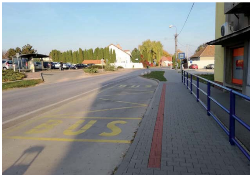
Nová autobusová zastávka v Pustých Úľanoch.