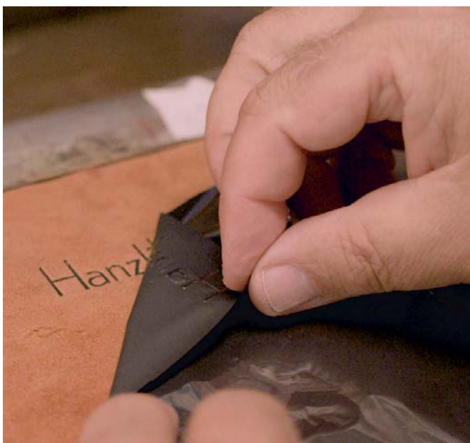
Každý výrobok z trnavskej knihárskej dielne je originál.