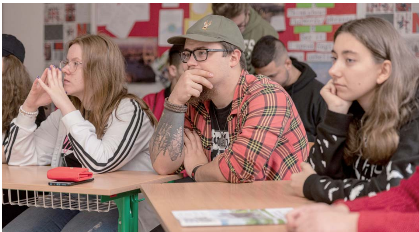
Stredoškôľakov zaujímali rôzne témy, ktoré sa dotýkali politiky Európskej únie - brexit, Turecko i rozšírenie EÚ.