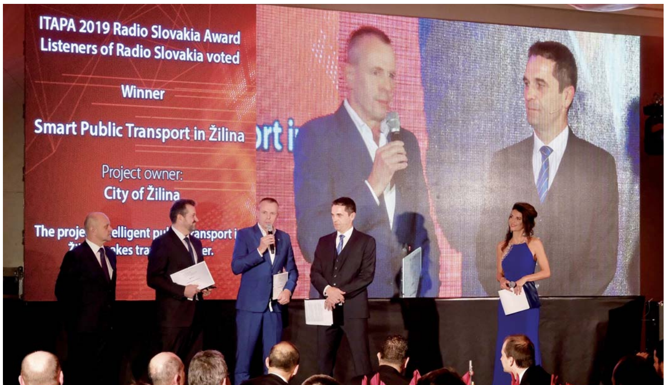
Projekt získal Cenu Rádia Slovensko. Samospráva sa do súťaže zapojila s inovatívnymi riešeniami, ktoré by mali výrazne znížiť meškanie spojov a ušetriť pohonné hmoty. Projekt inteligentnej MHD v Žiline riešila pre mesto spoločnosť ALAM. O prvenstve rozhodli poslucháči Rádia Slovensko v hlasovaní, ktoré sa uskutočnilo na jeho internetovej stránke. V konkurencii piatich finalistov získal žilinský projekt 634 hlasov. Zástupcovia mesta a partneri projektu si prevzali ocenenie na kongrese ITAPA 2019 počas slávnostného večera 12. novembra tohto roku.