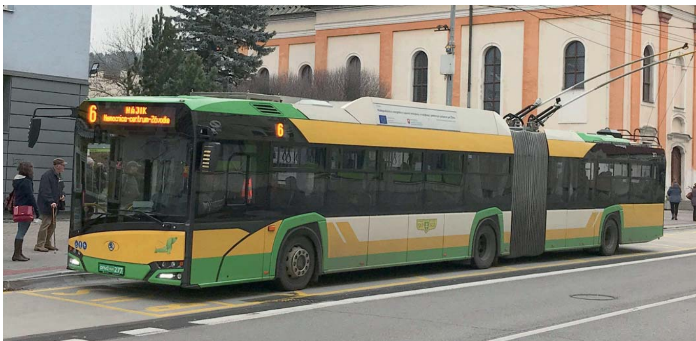
Vozidlá mestskej hromadnej dopravy v Žiline budú prechádzať cez križovatky plynulejšie, čo umožní lepšie dodržiavať cestovný poriadok.

Neustále narastajúci počet osobných áut je vážnou témou vo všetkých väčších i menších slovenských mestách. Dopravné kapacity sú častokrát maximálne využité, vo viacerých prípadoch doslova preťažené.