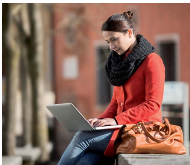
Mestá a obce majú v rámci výzvy možnosť vybudovať na svojom území bezplatné wifi zóny pre obyvateľov i turistov.

Úrad vicepremiéra uzatvoril piate hodnotiace kolo dopytovej výzvy, do ktorej sa mohli v termíne od 13. augusta do 13. novembra 2019 prihlásiť obce a mestá, ktoré majú záujem o podporu pri vybudovaní wifi zón. Šieste kolo dopytovej výzvy je otvorené od 13. novembra 2019 do 13. februára 2020 alebo do vyčerpania predpokladanej alokácie na výzvu. K dispozícii je ešte suma 5 237 490,50 eur.