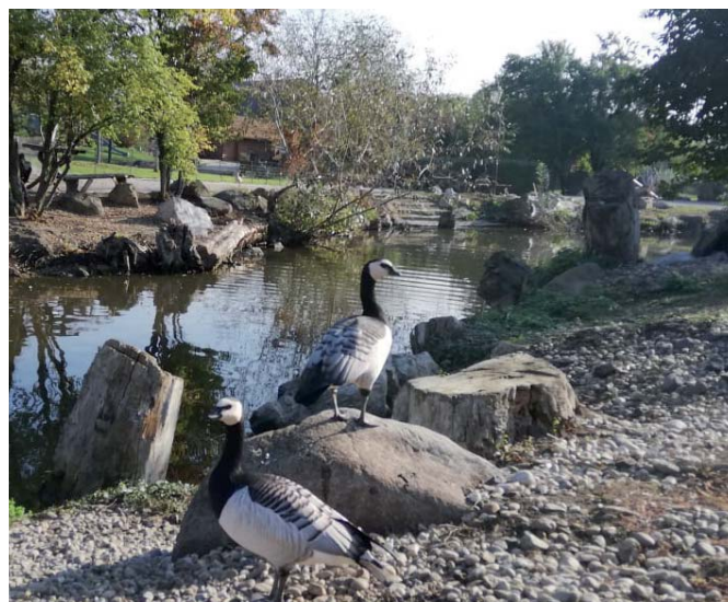
Vzácné bernikle si už všimli aj filmári.

Postupne za nimi začali chodiť ľudia z Pustých Úľan, že aj ich deti by rady videli, čo tu všetko majú, ako vyzerajú rôzne druhy kačiek, husí, chochlačiek či rýb. Chovajú tu aj hovädzí dobytok z Ázie či