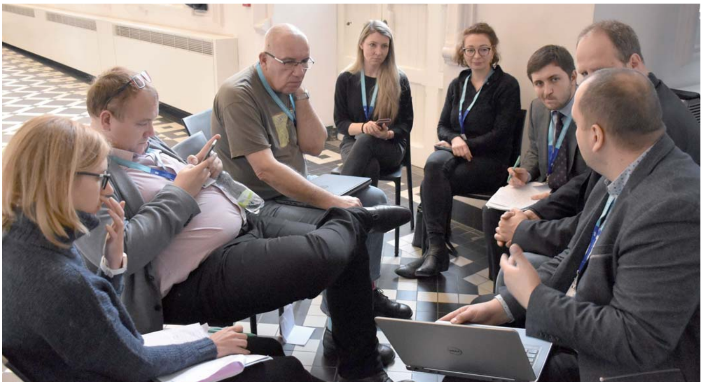
Na podujatí INFORM Network diskutovali tímy z rôznych krajín o spôsobe komunikácie v oblasti eurofondov a plánoch na ďalšie obdobie.

Zasadnutie INFORM Network, pracovnej skupiny pre informovanosť a publicitu na úrovni Európskej komisie zloženej zo zástupcov manažérov pre publicitu všetkých členských štátov, sa konalo 26. až 28. novembra 2019 v belgickom meste Gent.