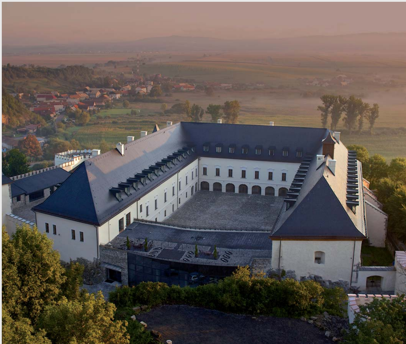
Rekonštruovaný Zámok Viglaš.