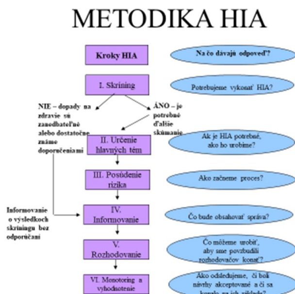
Obrázok 2: Prehľad metodiky posudzovania vplyvov na zdravie

Ako sa robí posudzovanie vplyvov na zdravie vo svete: